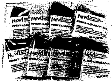
▲スポーツタイプ(立体加工)