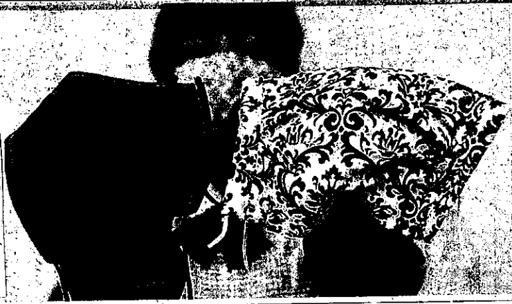
阪神鋼材が作る「尼のマスク」。左がスポーツタイプで、右がフリータイプ 〓尼崎中大浜町の同社で

同市大浜町の溶接機材などの専門商社「阪神鋼材」は、マスク不足が深刻だった3月に製造を開始。当初は、創立70周年の記念事業の一環として